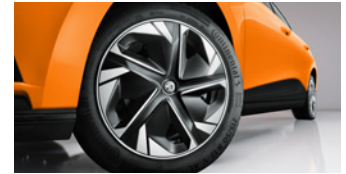
Jantes alliage 17" avec enjoliveur aérodynamique bi-ton