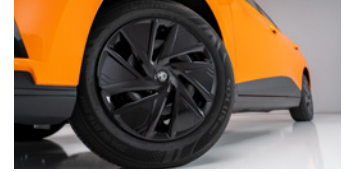
Jantes acier 16" avec enjoliveur aérodynamique noir