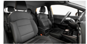
Sièges en tissu noir