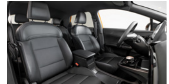
Sièges en similicuir/tissu noir