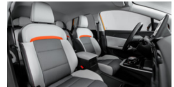
Sièges en similicuir/tissu gris (option à 650 €)